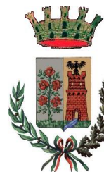
CITTÀ DI ROSARNO