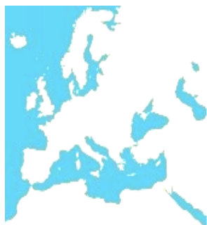
ASSOCIAZIONE MEDITERRANEA DI SOCIOLOGIA DEL TURISMO